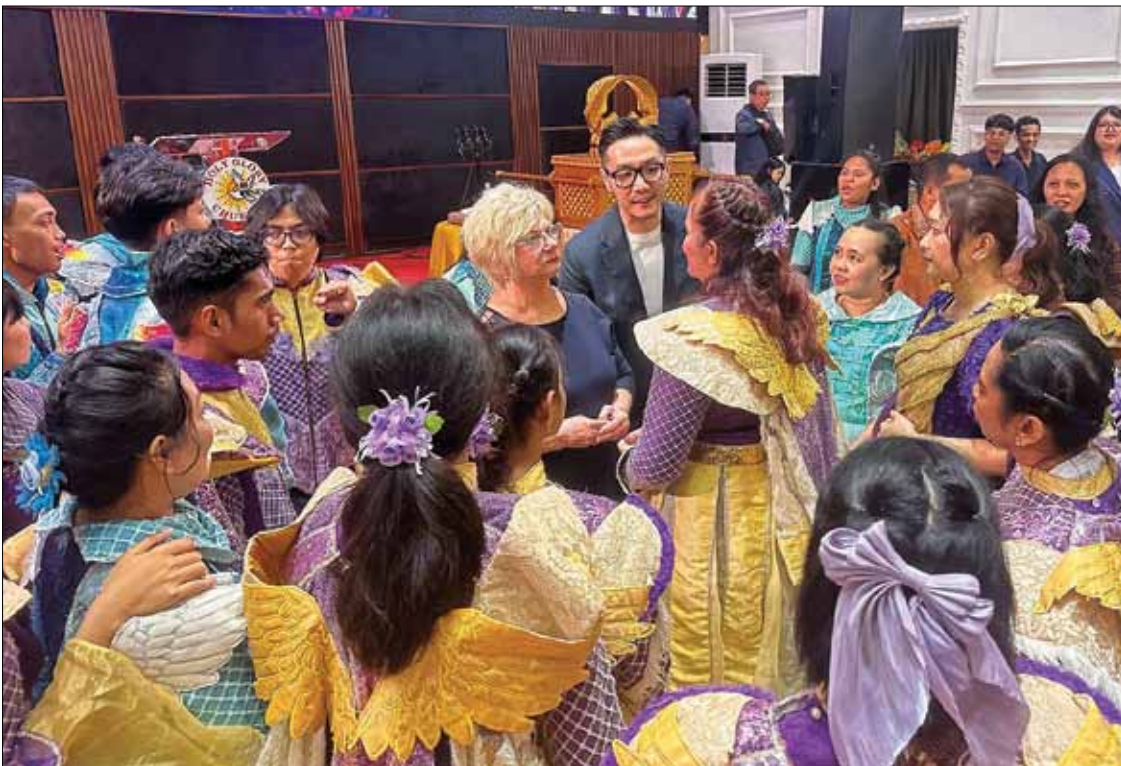
Papuan kokousväki oli hyvin nuorta.