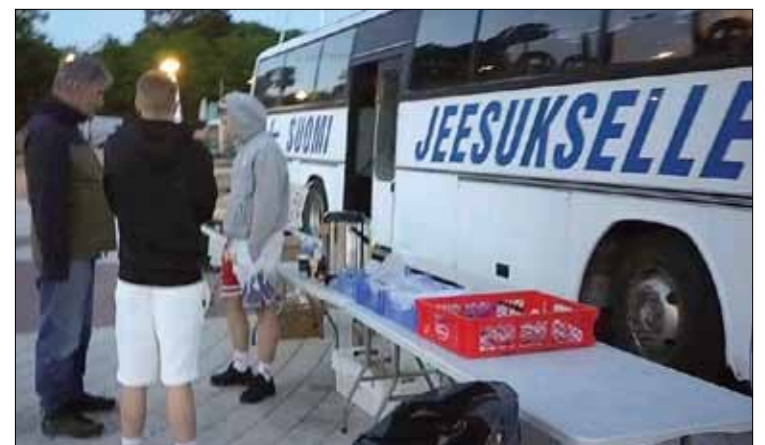
Suomi Jeesukselle linja-auto herättää myös huomiota.