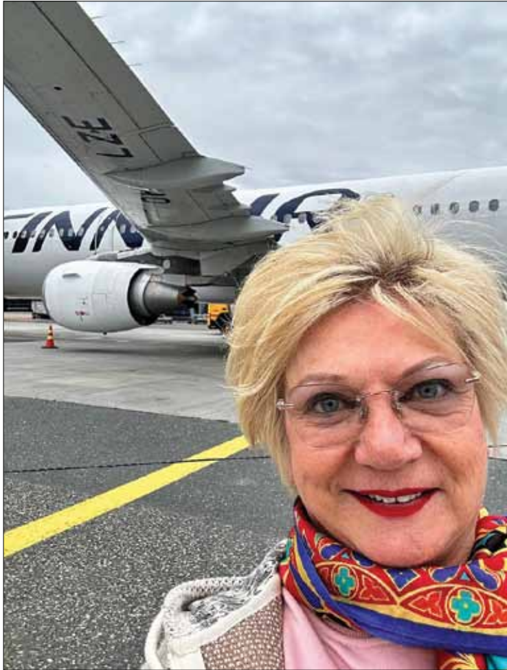
Glory tekee paljon lähetysmatkoja eri puolille maailmaa.

- Lapsihuoneessa oli myös kuolemansairaita rottia, joista lähti karva, ja yöllä ne vilistivät kuin omistaisivat koko paikan. Jos he eivät olisi niin sairaita, he varmaan olisivat syöneet pienet lapsi-