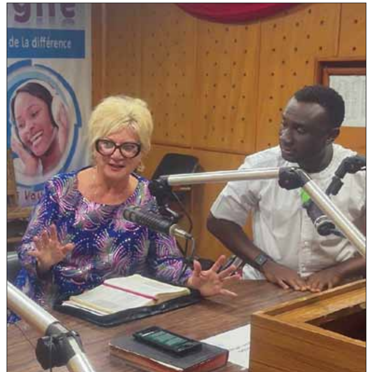
Glory suorassa radiolähetyksessä.